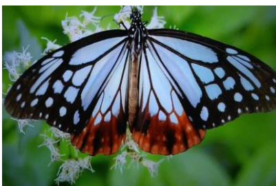
▲フジバカマに飛来するアサギマダラ

秋の七草として知られている「フジバカマ」に「アサギマダラ」という渡りの蝶が、気温20°前後の涼しくなるこの時期に富士宮市内にも訪れます。最近、柚野 興徳寺や沼久保 水辺の楽校のフジバカマに飛来するとの情報もあります。興味のある方は是非…。