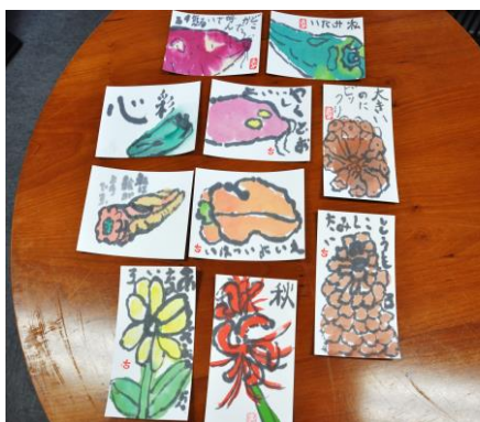
▲絵手紙教室のみなさんの作品